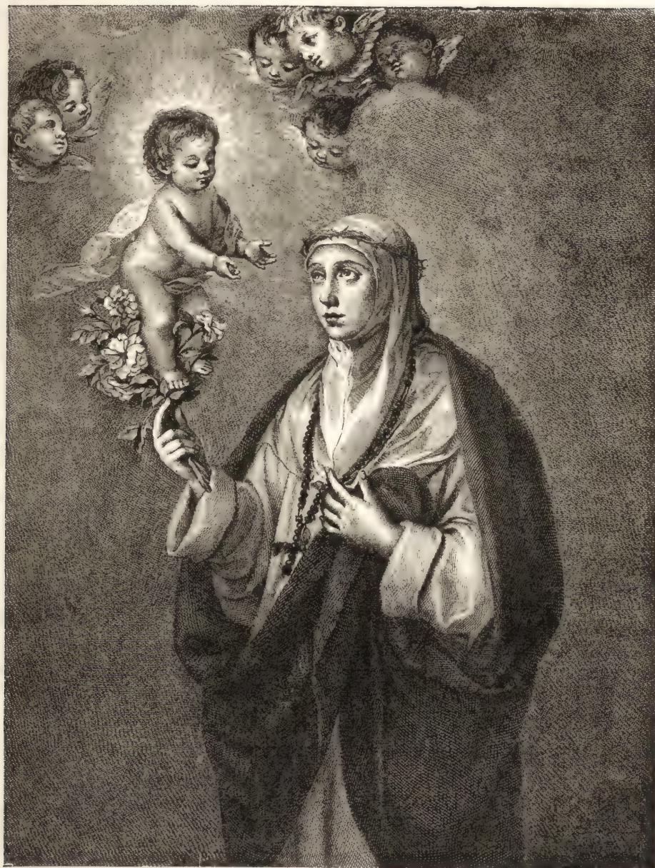
SAINTE ROSE DE LIMA.